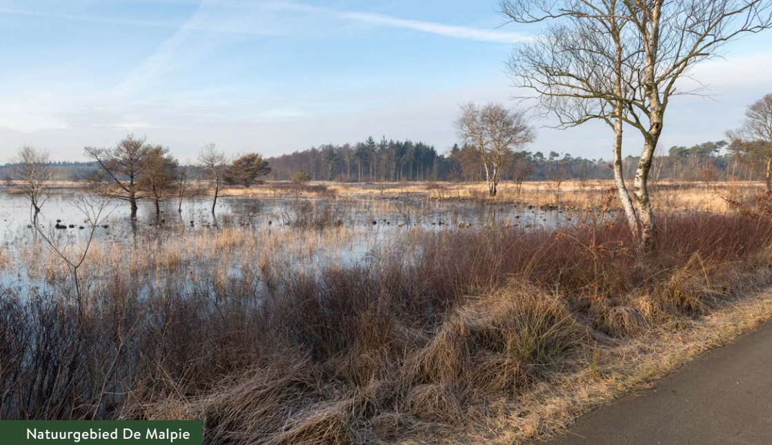
Natuurgebied De Malpie